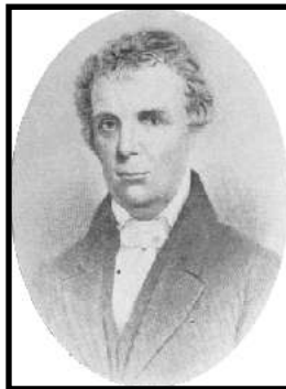
Barton W. Stone

El cuerpo de Cristo, crucificado en el Calvario, está representado por el único pan o hogaza, y los Cristianos unidos en un solo cuerpo son coparticipes de él. La Nueva Traducción es precisamente de acuerdo con el texto original. De este modo; “La copa de bendición que bendecimos; ¿No es la participación conjunta de la sangre de Cristo? el pan que partimos; ¿No es la participación conjunta del cuerpo de Cristo? Porque hay un solo pan, nosotros, los muchos, somos un solo cuerpo: porque todos participamos de ese único pan.”